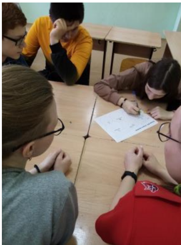
Классный час в 8 классе